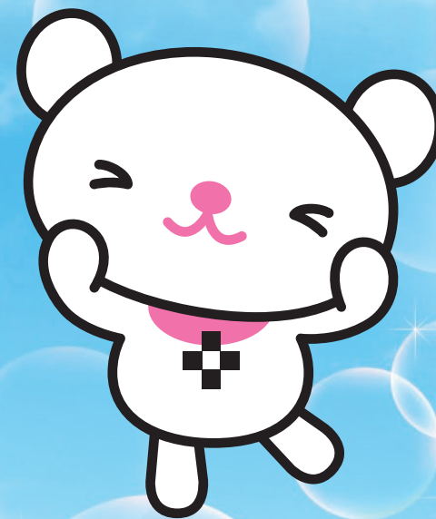
十文字学園女子大学 マスコットキャラクター プラスちゃん