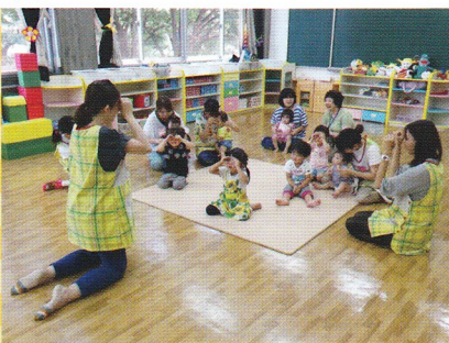
+ママの手遊びや読み聞かせを楽しむ時間も