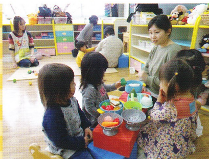
子ども同士のやりとりも自然に生まれます