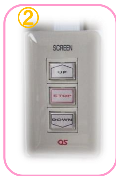
壁面スクリーンスイッチ